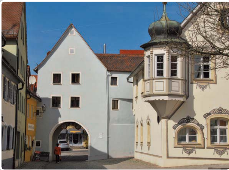
Bild 2 Eglloffsteiner Tor in Gräfenberg. Eines der wenigen Stadttore, die als echter Torbau zur Fränkischen Schweiz erhalten sind. Rechts davon das Rathaus.