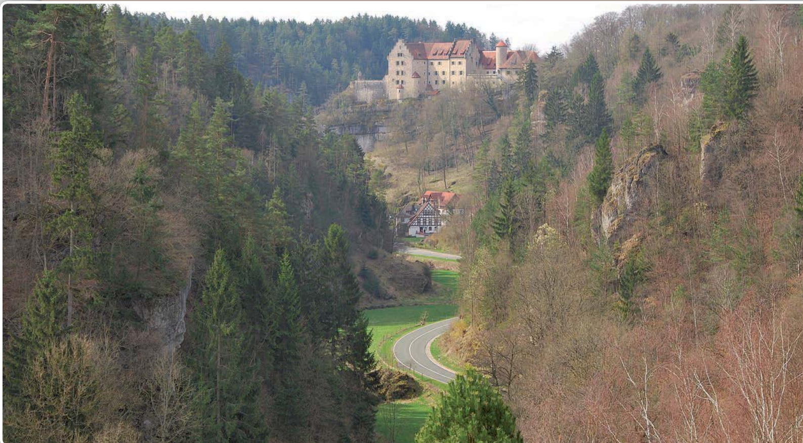
Bild 7 Enge des Ailsbachtals dicht nach dem Eintritt in den Weißjura-Dolomit. Vom Schweinsberg unterhalb Klausstein, mit Schloss Rabenstein und Neumühle.