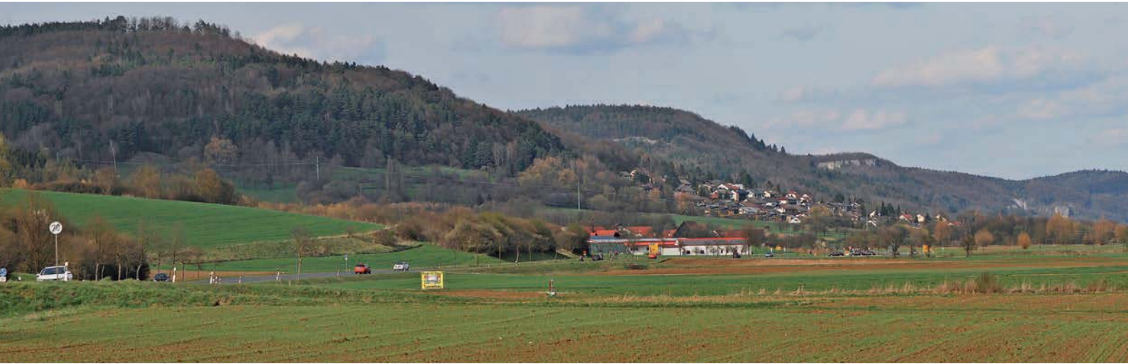
Bild 9 Aus der Felsenenge bei Streitberg im Hintergrund tritt die Wiesent in den weiten Ebermannstädter Taltrichter aus. Blick vom

hen Spornen — also lieblicher Rand der Fränkischen Schweiz.