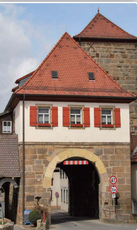
Bild 4 Oberes Tor in Weismain – ein noch erhaltener Torbau zur Fränkischen Schweiz.

Simmelsdorf wirbt ebenfalls mit der Lage „am südlichen Tor zur Fränkischen