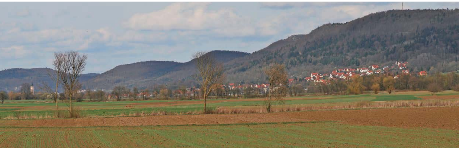
Wiesenttal in Höhe von Reifenberg talaufwärts gegen Ebermannstadt.