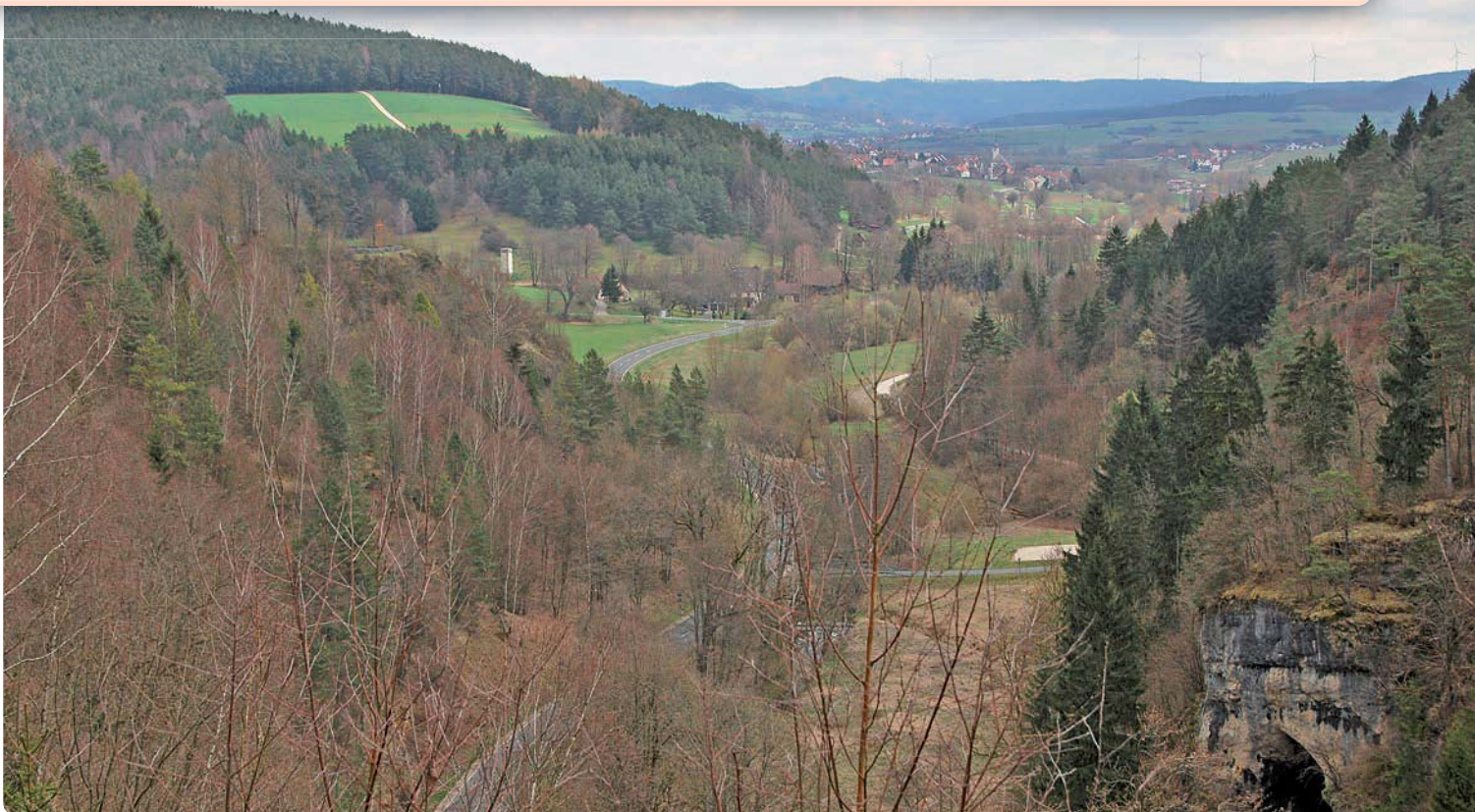
Bild 8 Blick aus der Felsenge des Ailsbachtals hinaus in die Weite des Ahorntals mit Kirchahorn, dahinter der Lindenhardter Forst, ein Quellgebiet des Ailsbaches. Standort unterhalb der Klaussteinkapelle.