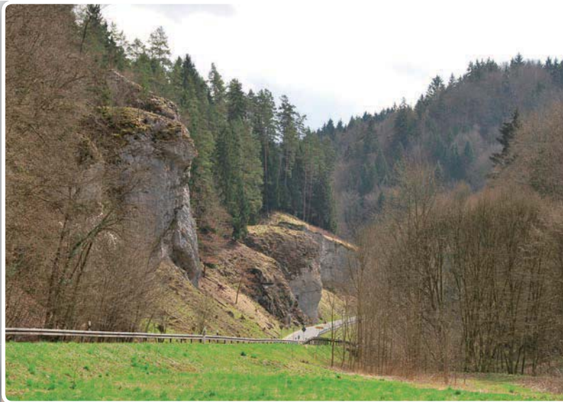
Bild 3 Austritt des Weismaintals aus der Felsstufe des Weißen Juras bei der Waßmannsmühle.

Die Fränkische Schweiz hat rings herum viele Zugangs-Tore. Im Bild 1 sind nur die wichtigsten eingetragen. Manche dieser Orte an der Pforte schmücken sich als „Tor zur Fränkischen Schweiz“. Selten schmücken noch echte Torbauten das „Tor zur Fränkischen Schweiz“, wie in Gräfenberg und Weismain.