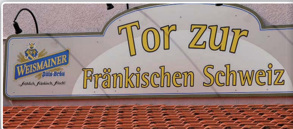
Bild 5 Gaststätte „Tor zur Fränkischen Schweiz“ in Weismain in der Sandleite.

ScheBlitz im Leitenbachtal, ebenfalls einem Albbach, meldet sich wieder mit „Tor zur Fränkischen Schweiz“. Wie alle Albbäche, enden ihre Täler talaufwärts auch hier an steiler Stufe, etwa der Würgauer Steige oder Ludwager Steige, über die man bald zu Wiesent- und Aufseßquelle gelangt. Diese Steigen sind zudem malerisch geziert durch die Giechburg und GÜgelkapelle auf ho-