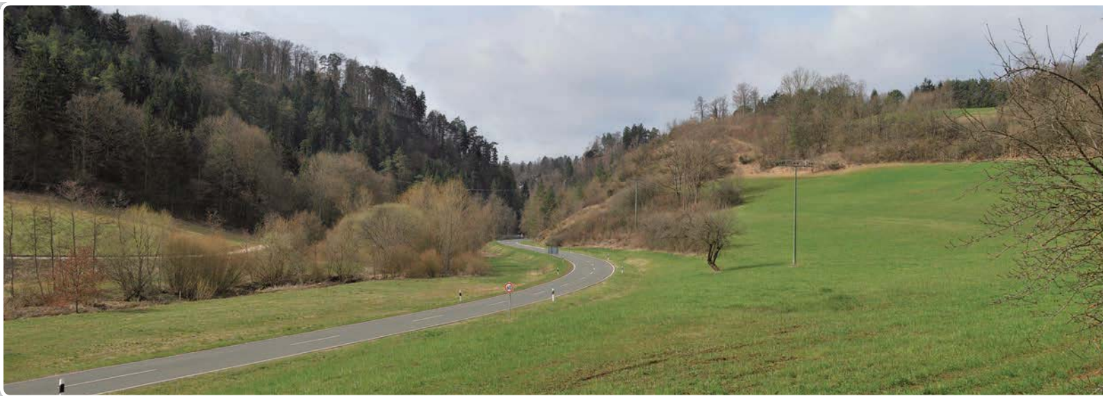
Bild 6 Eintritt des Ailsbachs aus der Weite des Ahorntals in die Enge der Weißjura-Steilstufe bei der Schweinsmühle.